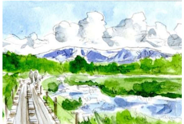
1、この構図では 入道雲が重要です 遠くの山も正確に下絵に描いておきましょう 4、少しずつ色を重ねていきます 人物はシルエットでいいでしょう